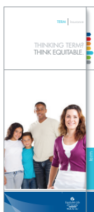
Vous songez à une assurance vie temporaire? Pensez Équitable. (n° 1342FR) (offerte en français et en anglais)

Les brochures suivantes à l'intention de la clientèle sont disponibles afin de vous aider à générer la vente des produits d'assurance vie temporaire :