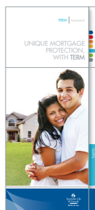
L'assurance vie temporaire, une protection hypothécaire unique (n° 1255FR) (offerte en français et en anglais)