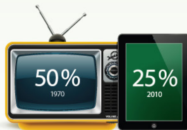
拥有养老金固定收益计划 (Defined Benefit Pensions) 的加拿大工薪阶层 5

养老金固定收益计划 (Defined Benefit pensions) 多年来一直处于缩减趋势。不仅如此,政府提供的养老金方案似乎也不足以维持退休人员所期望的生活水平。