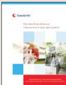
Données financières sur l'assurance-vie avec participation (imprimé F46-4758)