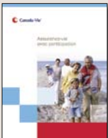
Assurance-vie avec participation – Guide du client (imprimé F46-5482)