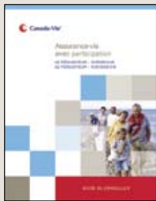
Assurance-vie avec participation – Guide du conseiller (imprimé 560 FR)