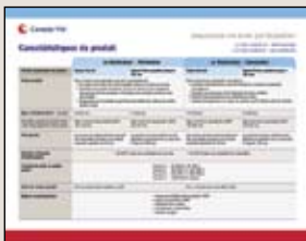
Sommaire des produits d'assurance-vie avec participation à l'intention des conseillers (imprimé 3156 FR)